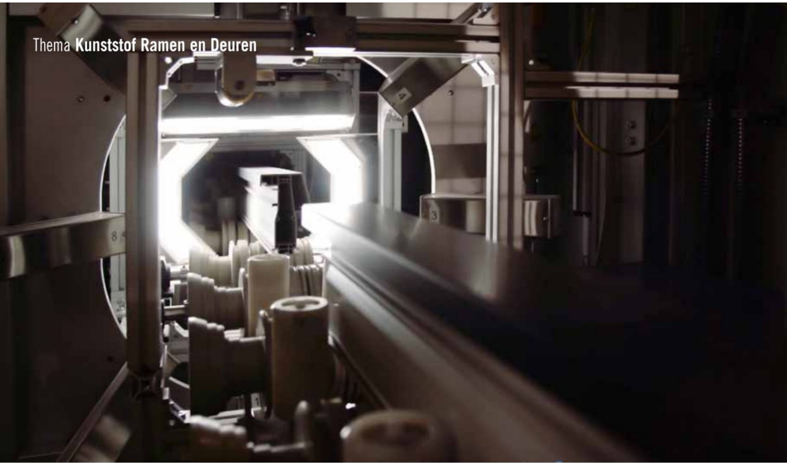
Afwerking van profiel met proCoverTec.

Tekst: Jan Mol